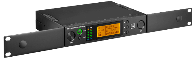
Montaje sin soportes de antena

Al montarlo sin soporte de antena, la estructura debe aparecer tal como se muestra.